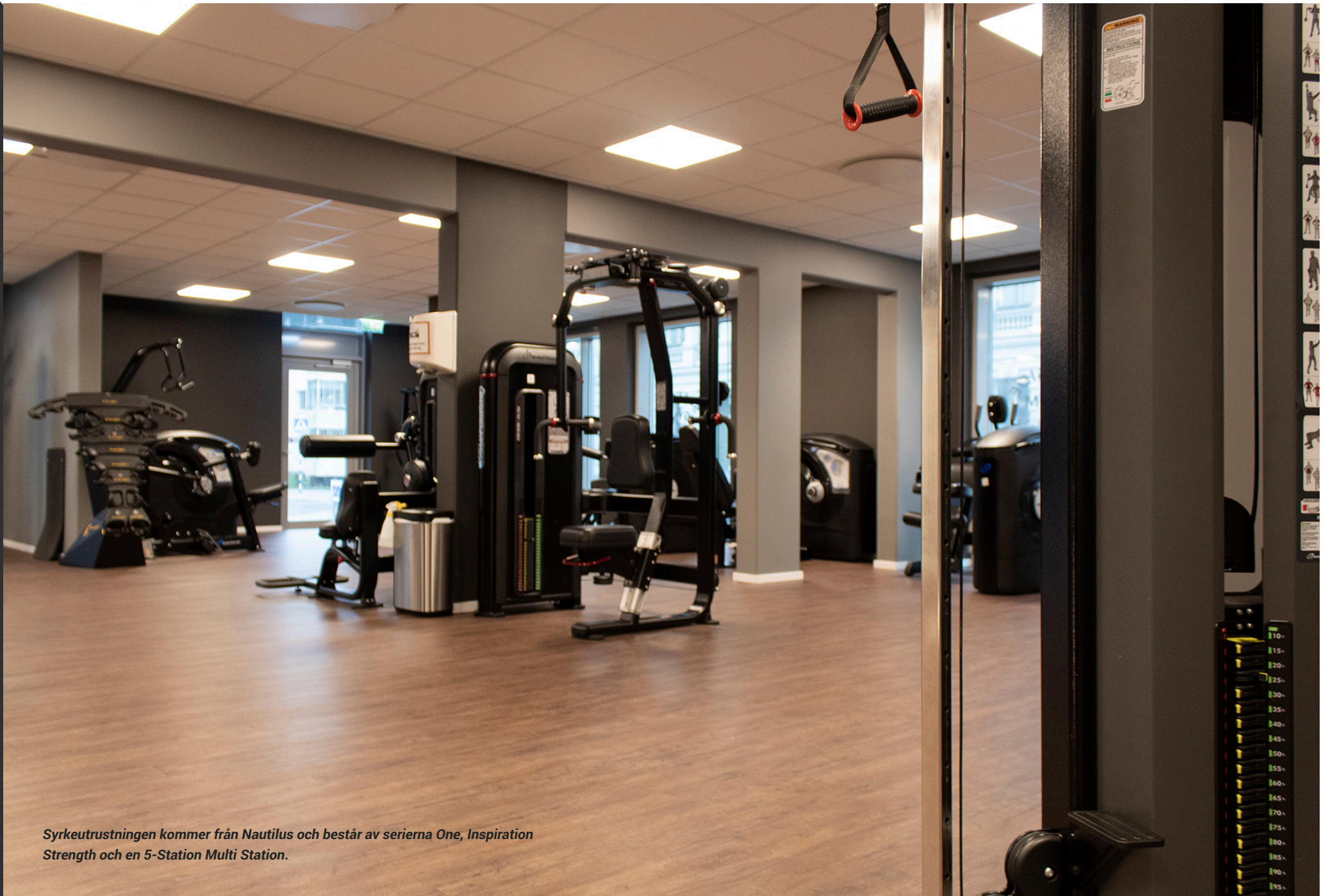
Syrkeutrustningen kommer från Nautilus och består av serierna One, Inspiration Strength och en 5-Station Multi Station.