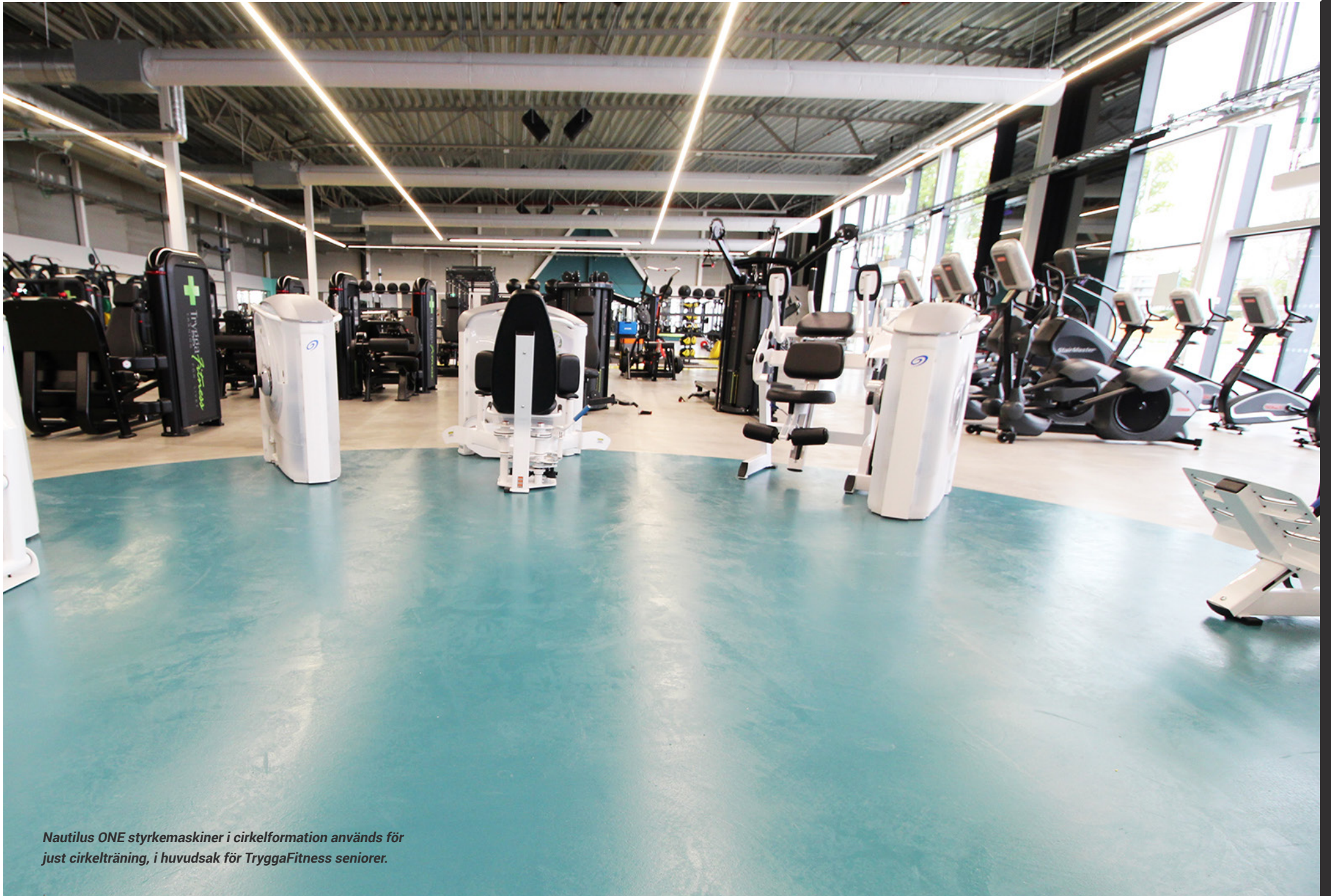
Nautilus ONE styrkemaskiner i cirkelformation används för just cirkelträning, i huvudsak för TryggaFitness seniorer.